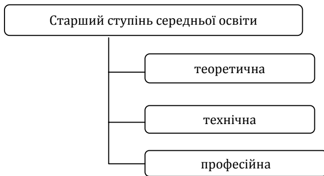
Схема 2 СТРУКТУРА СЕРЕДНЬОЇ ОСВІТИ РУМУНІЇ

Подвійна роль системи професійної і технічної освіти – соціального та економічного характеру – забезпечується за рахунок того, що вона сприяє розвитку професійної сфери в цілому та економічному зростанню Румунії, а також особистому вдосконаленню, соціальній інтеграції і громадянськості. ПОН є основою для здобуття компетенцій, пов'язаних із майбутньою професійною діяльністю, забезпечує кар'єрне зростання надалі. Професійна й технічна освіта застосовує механізми проведення виробничої практики, організованої освітніми установами. Вона надається у рамках "доуніверситетської освіти" – середньою і вищою (неуніверситетською), включаючи 1-3 рівні професійної класифікації або підготовки (як це встановлено в Румунії), тоді як 4 і 5 рівні відповідають вищій освіті. Програма ПОН може бути частиною прямого або послідовного циклу здобуття професії. Це передбачає вступ і завершення професійної освіти після опанування 1 і 2 кваліфікаційних рівнів; причому результатом завершення є одержання кваліфікаційного свідоцтва, що є частковою кваліфікацією.